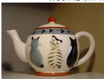
Week 12 t/m 17