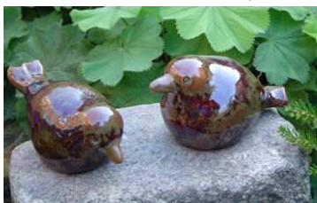
Week 5 t/m 11

Tijdens de cursussen staat steeds een thema centraal. Cursisten kunnen kiezen om mee te doen aan het thema, of werken aan een eigen project dat los van het thema staat.