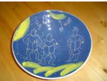
Week 25 en 26

In deze serie kiezen we eens niet voor de gladde, en vaak glanzende glazuren waarmee meestal gewerkt wordt. We gaan experimenteren met glazuren die textuur in zich hebben. Een schrompelglazuur past niet mooi om de scherf heen; het trekt zicht terug en vloeit niet egaal uit. Een craqueléglazuur vertoont grote of kleine scheurtjes. Een vulkanisch glazuur heeft een korstachtig oppervlak. We krijgen het recept van een kleurloze basis, en je kunt zelf experimenteren met kleurende oxides.